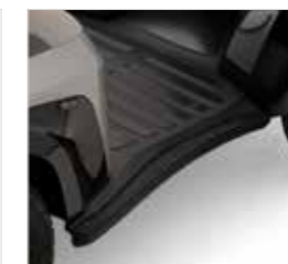
Rubber impact bumpers