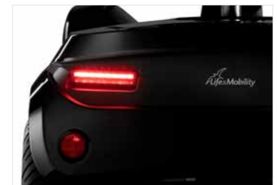
Opvallende led-verlichting (Presto, Presto S)