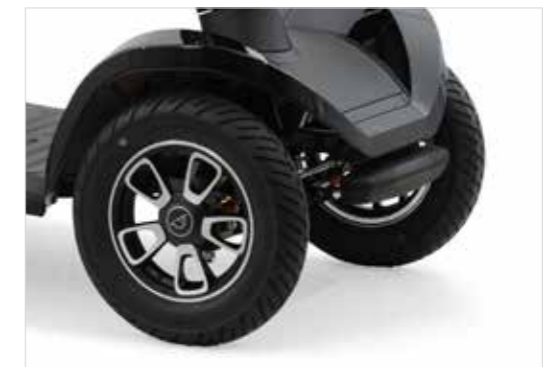
Grote wielen (Solo, Presto, Presto S)