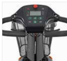
Display met noodstopknop