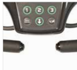
Duimbediening met drukknop (optie)