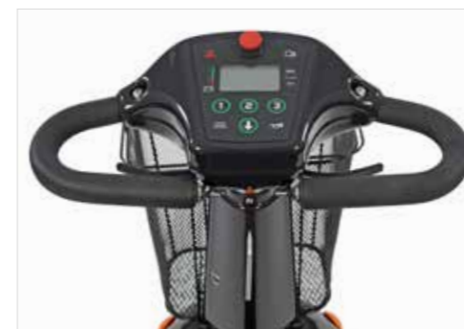
Display met noodstopknop (Solo)