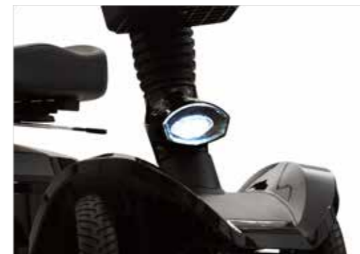
Meedraaiende koplamp (Presto, Presto S)